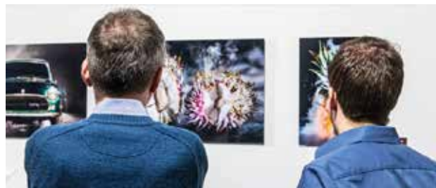
Stand: Oktober 2022 (Änderungen vorbehalten)

Um das Schulgeld als Sonderausgaben geltend machen zu können, müssen sie Anspruch auf einen Kinderfreibetrag oder Kindergeld haben. Es können 30%, höchstens aber 5000,00€ des Schulgelds im Jahr als Sonderausgaben geltend gemacht werden.